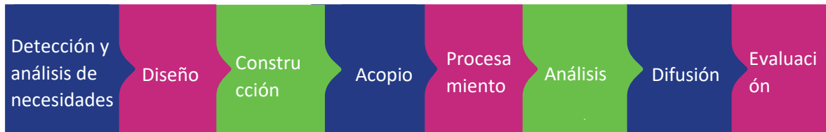
Ilustración 1 Fases de la operación estadística

A continuación, se describen los diseños de la operación estadística de manera organizada, el cual, permite identificar los métodos, las técnicas, los procedimientos y las estrategias que se aplican para reunir, procesar los datos y analizar e interpretar los resultados de la operación estadística, esto con el ánimo de cumplir los objetivos y satisfacer las necesidades de información.